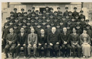
南山中学校入学記念写真 1932年