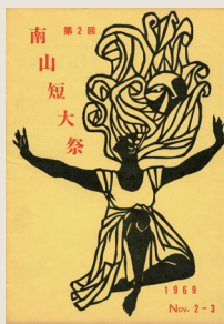
南山短期大学祭 パンフレット 1969年