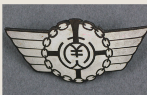
南山外国語専門学校 校章