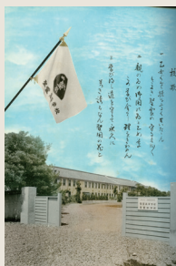
聖霊高等学校・中学校 三の丸校舎 1961年 卒業アルバム『誠実』