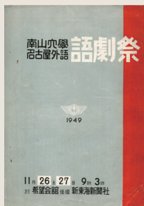
南山大学・名古屋外国語 専門学校語劇祭 パンフレット