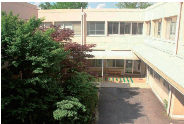
写真2 図書館側から見下ろす(図2青⇒方向)「もうひとつの中庭」。筆者の研究室は右側の二階。