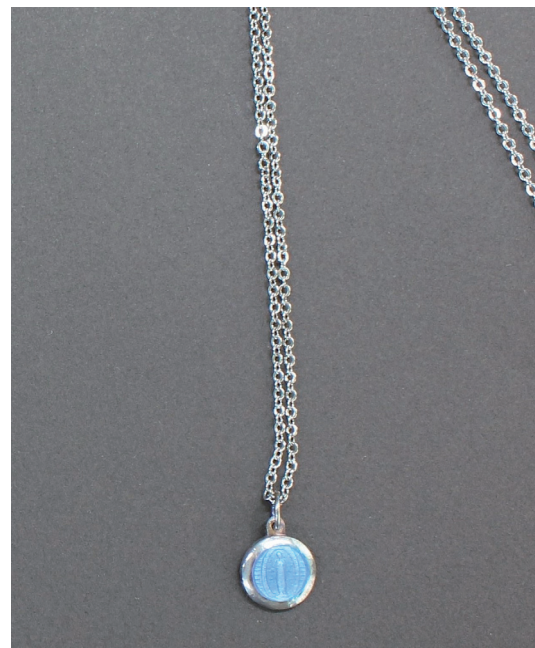
卒業記念ペンダント