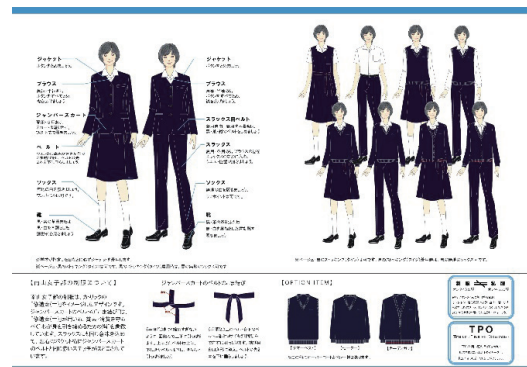
制服着こなしガイドブック完成版