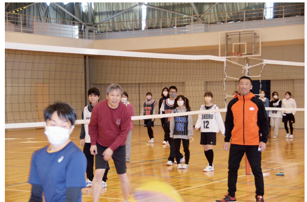
2023年2月スポーツ大会

もう1つ、職員室が「呼びつける」場所ではなく、教員との語り場・くつろぎの場、居場所のない生徒の居場所として認知されてきたことも「奇跡的」でした。それが幾重にも豊かな関係づくりに寄与したことは、多くの生徒・教員が認めるところです。