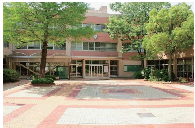
写真1 正門を抜けて階段をあがった中庭を臨む

子たちの中には国や文化の壁を越えて起業した人、研究者になった人、海外に長く拠点を置いて仕事している人など、分かり易く華やかな人生を送る人たちも少なくはなく、その活躍の報告を聴く度にさもありませんと誇らしく感じたことも何度もある。しかし、それはそれとして、長い教育職員としての生活の中で残り、今でも南山短大の中核として残っているものは、実はもう少し地味な教育研究活動であり、その中でそれぞれに心砕き奮闘する(そしてうまく行かず足掻く)学生たちの姿である。そ