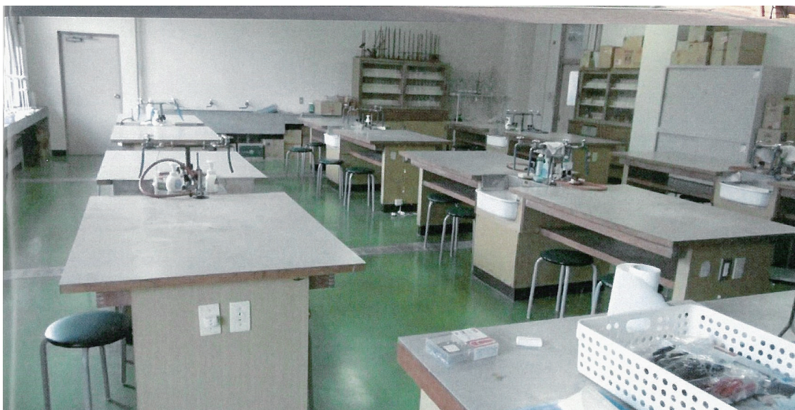
旧校舎の第2理科室