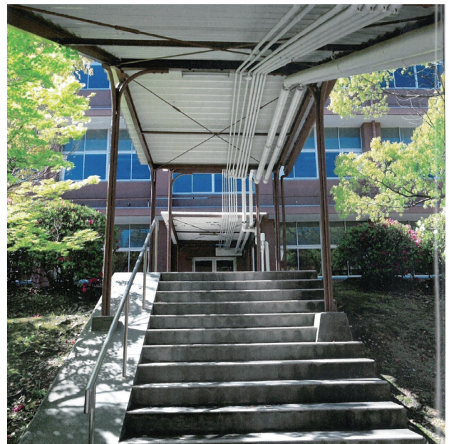
旧校舎の理科室からB棟への渡り廊下

これからも、40年前と同じように、多くの先生方の挑戦や努力が詰まった新しい理科室で、さらに聖霊の理科教育が発展することを願っています。