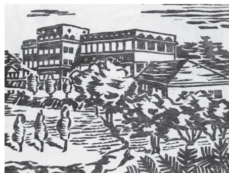
南山アーカイブズ (ライネルス館)