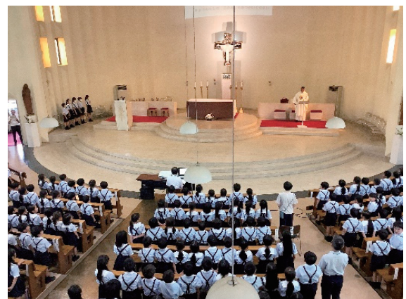
(南山大学附属小学校教諭)

今年度7月に行われた静修では、全校児童が4年ぶりに南山教会に集まることができ、エネルギーに満ちた歌声が聖堂内に響き渡りました。少しずつ、コロナ禍から通常の生活に戻り、南山小にも子どもたちの歌声が戻りつつあります。神様は子どもたちに歌声という素晴らしい楽器を与えてくださいました。子どもたちの歌声を大切にしながら、南山小が一步ずつ前に進んでいけることを願っています。