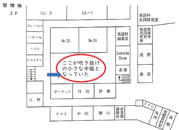
図2 繋がっていて管理棟でもあり図書館棟でもあった部分の二階見取り図。真ん中の空間が「もうひとつの中庭」になっている。左隅の階段を降りると一階図書館へ至る。

大量の本、雑誌、辞書その他の資料はその圧倒的な文字情報の蓄積をもって「未知の領域がこんなにもあるのだ」という無言のメッセージを送り迫ってくる。そこへ通いつめて落ち着いて過ごすためには、その圧力に対してまったく鈍感であるか、もしくはそのメッセージを受け止めて対峙する気概を持ち、そのことをむしろ楽しむことができる心性を持つかのどちらかという気がする。平たく言えば「本が好き。文字が好き。知らないことの扉を開けるのが好き。文字情報をコツコツと忍耐深く解読し咀嚼する努力が苦にならない。少なくともそれを頑張れる。」という学生たちであろう。そうした学生たちは、本当によくこの小さな中庭を通して図書館に出入りしていたのである。そして、どちらかと言えば大きな中庭での活動は苦手であるタイプが多かった。そんなわけで、わかりやすく目立つわけでもなく、わかりやすく成果を上げてトロフィーを持ち帰るなどの功績があったわけでもない。でも、こうした学生を毎年ずっと観察者として追っていた筆者は、それぞれの学生の達成した小さな学びの成果を知っている。英語の読本を読みつくす勢いで借りまくって四苦八苦しながらも内容をまとめて報告していた学生。授業で紹介したり指定したりした、彼女たちにはややハードルが高いかと思われる専門書を何回も借りて読んでいた学生。その昔、図書館の本に添付されていた貸し出しカードによって、どれくらい借りられているのかが一目で誰でも確認できる時代があった。背表紙裏のカードの記録を見て、こんな歯ごたえのある専門書によくも食らいついたものだ、と感心したことも一度や二度ではない。そういった学生たちの努力は、華々しくはなくても、衆目を集めるものではなくても、授業内報告や英文演習(ゼミナールに近い授業)での英語小論文のような形で確かに結実していたのである。問題意識を持ち、調べ、検証し、考察するという、研究の基礎の