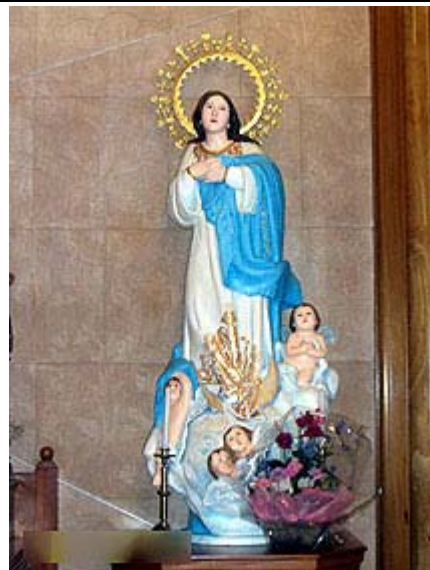
(写真) 浦上天主堂小聖堂(左上)、被爆のマリア像(右上)、 被爆した天使像(中左)、平和公園(中右) 大浦天主堂(左下)、復元されたマリア像(浦上天主堂)(右下)