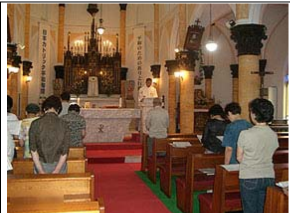
(写真) 食事の一例(海の幸満載です)(左)、平戸教会にてミサ(右)