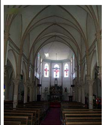
(写真)大瀬崎展望台(左上)、福江教会(中上)、井持浦教会(右上) 三井楽教会(左下)、水の浦教会(中下)、楠原教会(右下)