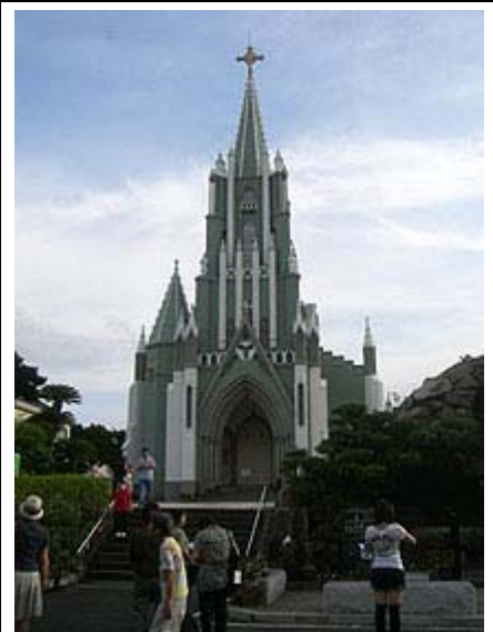
(写真) 紐差教会(左・中)、フランシスコ・ザビエル記念聖堂(右)