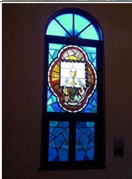
(写真)ハウステンボス(左上) 普賢岳(右上) 雲仙教会(下)